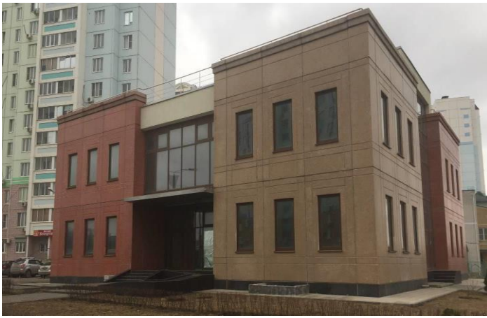
Фасад здания (вид с пр-та Маршала Жукова)